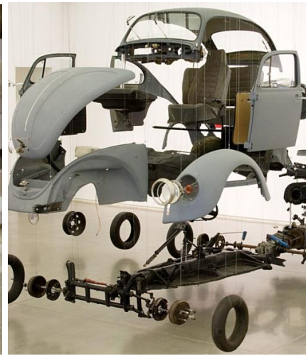
Fotos aus der Werkstatt